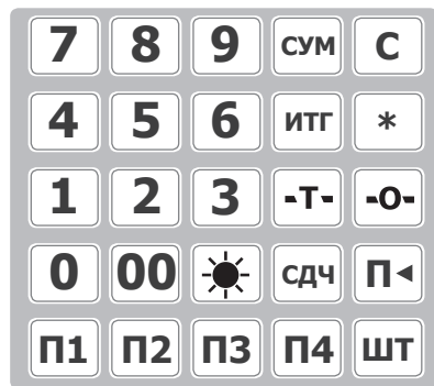
Рис. 3. Клавиатура