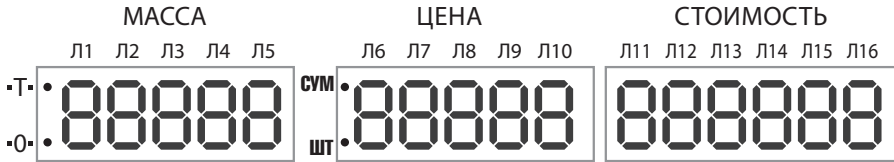
Рис. 2. Индикаторы